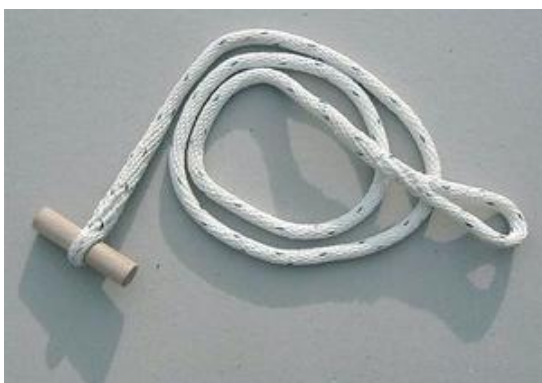
Polyesterseil spiralgeflochten, 10 mm Ø 1,6 m lang, 1 Seite mit Schlaufe 90 mm 1 Seite mit Holzknobel.

Es müssen genormte Geräte verwendet werden, an denen keinerlei Veränderungen vorgenommen worden sind (z.B. Mundstücke am Strahlrohr, zusätzliche Ösen am Saugkopf, Veränderungen an Ventilleine bzw. Saugschlauchleine, Schlauchträger, u.ä.). Bei festgestellten Veränderungen an irgendeinem Gerät, wird der Bewerbsleiter den Austausch des (der) betreffenden Geräte mit den Geräten des Veranstalters anordnen!