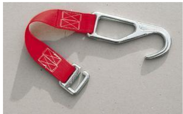
Gurtschlauchhalter nach DIN 14828 Perlongurt mit geschmiedeten Beschlägen