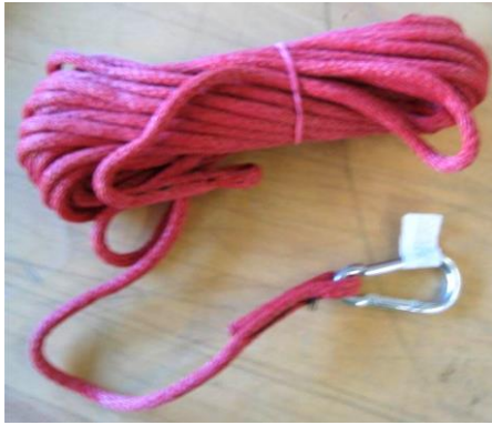
Original Ventil- bzw. Saugschlauchleine