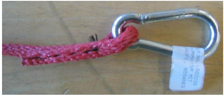
Karabiner mit original Einbindung und ohne jeglicher Markierung