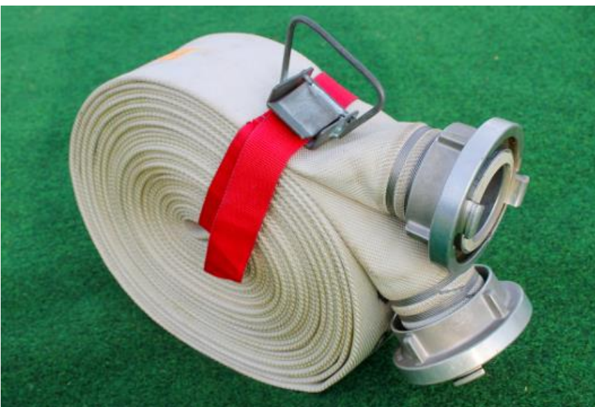
Original Schlauchträger (C-Schlauchträger mind. 60 cm, B-Schlauchträger mind. 70 cm)