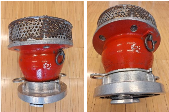
Saugkopf mit Ösen, Ring ( \varnothing max. 30mm) der Ventilleine muss frei beweglich sein.